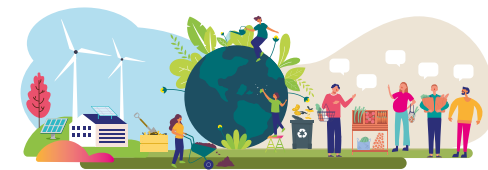
environnement - alimentation