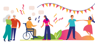
Loisir / culture